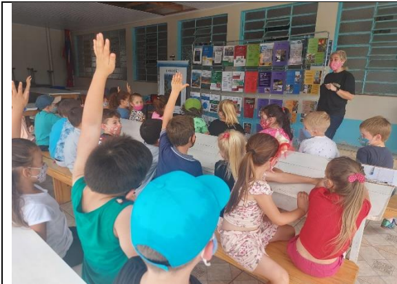
Foto 2 - Exposição Itinerante da FCE para os alunos da EMEB Miguel Pietroski em Erval Grande/RS.

No mês de novembro de 2021 se iniciou a circulação da Exposição Itinerante da FCE nos municípios atingidos pelo empreendimento. A atividade no município de Erval Grande foi realizada na EMEF Miguel Pietroski, no turno da tarde do dia 25 de novembro de 2021 e contou com a visita de 86 estudantes. A Exposição Itinerante foi montada no pátio da escola e os alunos foram convidados a ouvir uma breve apresentação sobre os painéis (Foto 2 e 3). Na sequência, os estudantes eram conduzidos a circular pelos expositores e conhecer as ações dos programas ambientais realizados pela FCE.