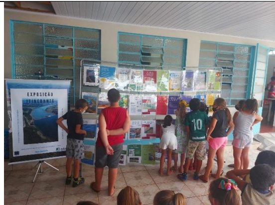
Foto 3 – Alunos da EMEB Miguel Pietroski em Erval Grande/RS observando os painéis da Exposição Itinerante da FCE.