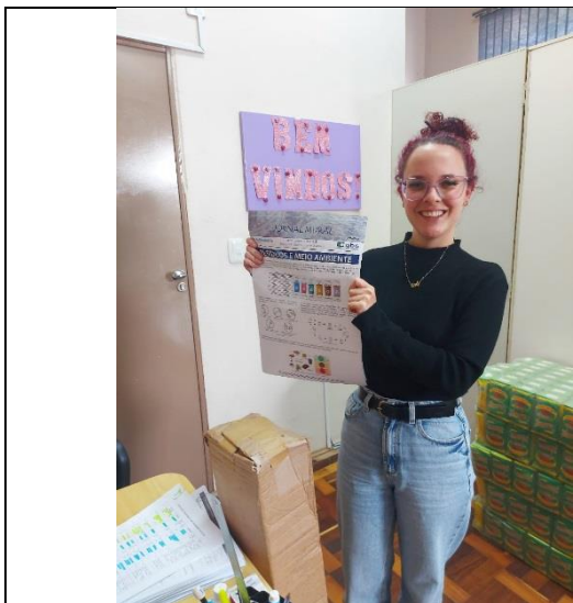
Foto 1- Jornal Mural “Resíduos e Meio Ambiente” entregue na Secretaria Municipal de Educação de Erval Grande/RS.